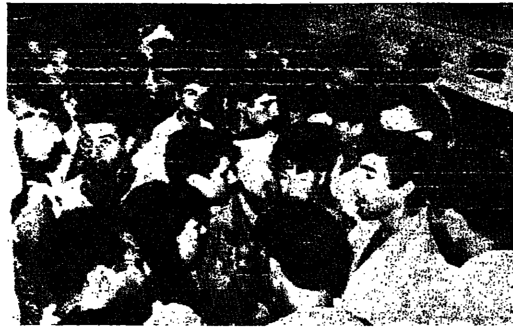
الشبان اليهود يتجهرون خارج مستشفى بيكور شوليم حيث نقل جرحى الانفجارات

على مشهد من البوليس الإسرائيلي وتحت حراسته ، قامت مجموعة من الشباب اليهودي بأعمال وحشية ضد السكان العرب الأمن ليلة الأحد الماضي على أثر انفجارات عنيفة هزت مدينة القدس وانت إلى مقتل عدد من جنود العدو استعداد للرد وقال شاهد عيان وصل إلى عمان مساء أمس ان السكان العرب كانوا في حالة غيابة شديد وقتوا على ساحة الاستعداد للرد على أي عمل انتحلي .